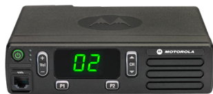
MOTOTRBO DM1000 SERIE