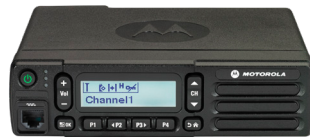
MOTOTRBO DM2000 SERIE